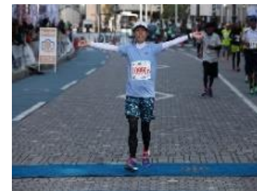
下関海響マラソン