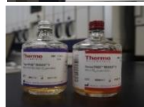
血液培養用カルチャーボトル

今年2月に自動血液培養装置バーサトレックを購入しました。旧方法は、マニュアル法で目視による判定をしていましたが、バーサトレックはボトル内のガス圧変化をモニタリングし、陽性時は、ブザー音が鳴るためリアルタイムで陽性判定ができるようになりました。また、旧方法より検出時間の大幅な短縮と検出可能な菌種の増加が見込まれます。