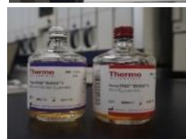
血液培養用カルチャーボトル

今年2月に自動血液培養装置バーサトレックを購入しました。旧方法は、マニュアル法で目視による判定をしていましたが、バーサトレックはボトル内のガス圧変化をモニタリングし、陽性時は、ブザー音が鳴るためリアルタイムで陽性判定ができるようになりました。また、旧方法より検出時間の大幅な短縮と検出可能な菌種の増加が見込まれます。