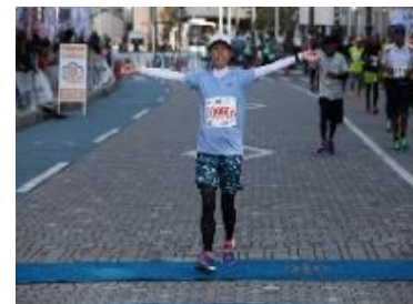
下関海響マラソン