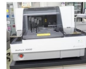
アレルギー特異IgE測定装置 DiaPack 3000